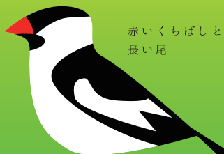
赤いくちばしと長い尾