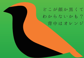
どこが顔か黒くてわからないかも？ 背中がオレンジ