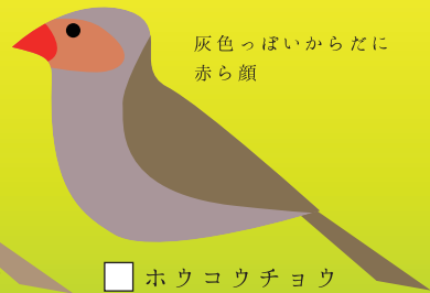
灰色っぽいからだに赤ら顔