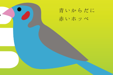
青いからだに赤いホッペ