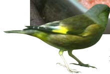
カワラヒワ 河原鶯