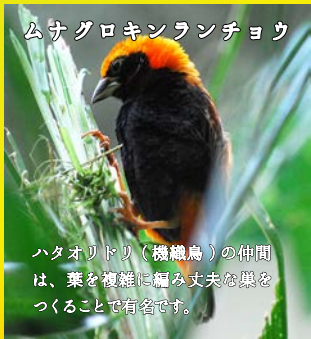
ムサグロキンランチョウ

ハタオリドリ(機織鳥)の仲間 は、葉を複雑に編み丈夫な巣を つくことで有名です。