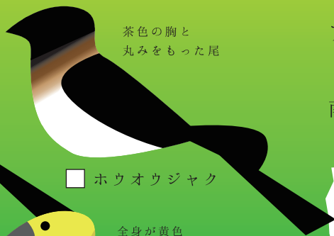
茶色の胸と丸みをもった尾